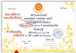
✗ วัดธรรมกาย ✗ แก้ไขคำว่า วัดธรรมกาย ให้เป็น วัดพระธรรมกาย ให้เรียบร้อยก่อนออกจากวัด