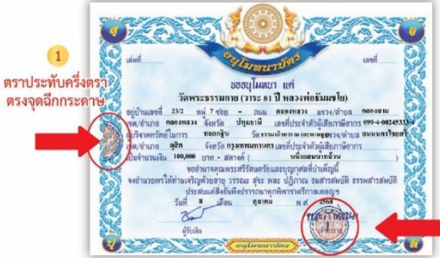
1 ตราประทับครึ่งตรา ตรงจุดฉีกกระดาษ 2 เพิ่มตราประทับอีก 1 ตำแหน่ง