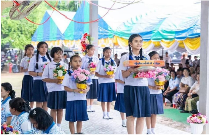
ภาพนำกล่าวถวายผ้ากฐิน (กล่าวด้วยตนเองไม่ตบทกล่าว,ไม่หลบตา)

(ให้ตั้งแถวแบบนี้เพื่อเดินเข้าสู่ศูนย์กลางพิธีก่อนนั่งร่วมพิธีกรรม)