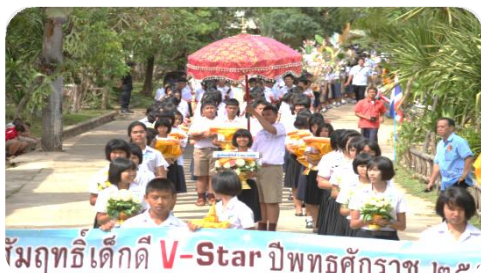
การตั้งขบวนอัญเชิญผ้าไตรกฐิน

ทุกฝ่ายงานร่วมกันจัดงานทอดกฐินด้วยรอยยิ้มและจิตใจที่เบิกบาน มีฝ่ายต้อนรับและปฏิสันถาร เพื่อให้ทุกคนที่มาร่วมงานเกิดความประทับใจและอยากมาทำบุญเช่นนี้อีก