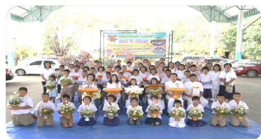
ถ่ายภาพหมู่ร่วมกัน