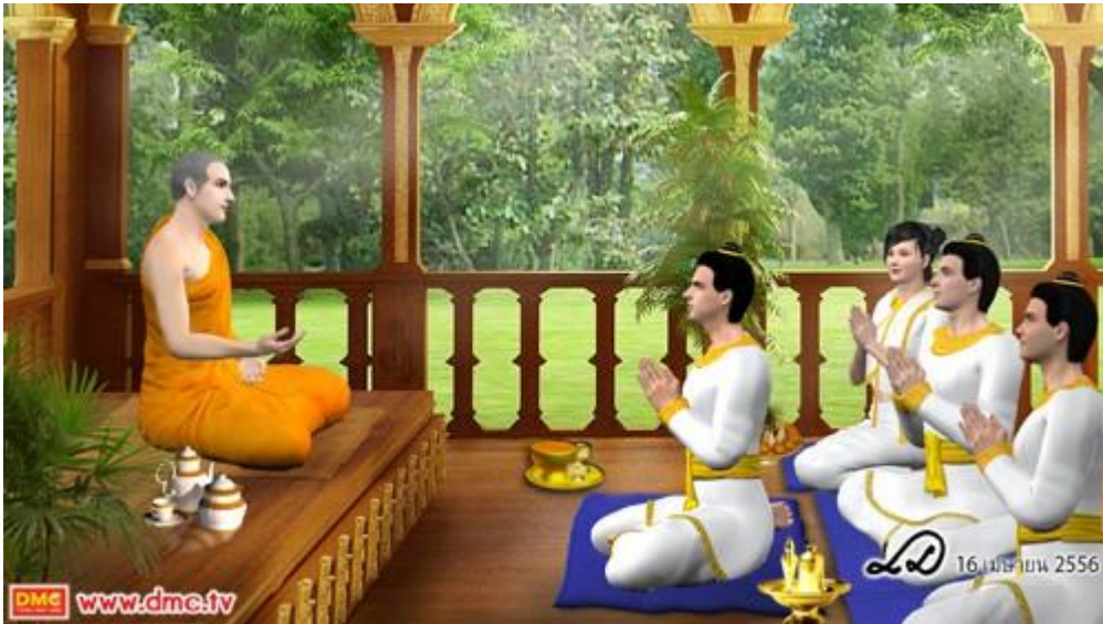
วิธีปฏิบัติขณะสนทนากับพระสงฆ์