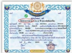
วัดพระธรรมกาย ✓

โปรดตรวจสอบชื่อ วัดพระธรรมกาย ให้ถูกต้อง ถ้าเขียนแค่ "วัดธรรมกาย" ไม่มีคำว่า "พระ" โปรดแก้ไขให้ถูกต้องก่อนออกจากวัด เนื่องจากทางกฎหมายถือว่าเป็นคนละวัด คนละนิติบุคคล