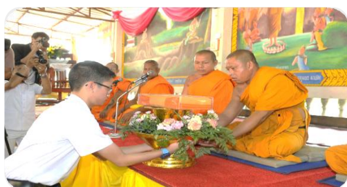
ประธานกฐินสัมฤทธิ์เด็กดี V-Star ถวายผ้ากฐิน