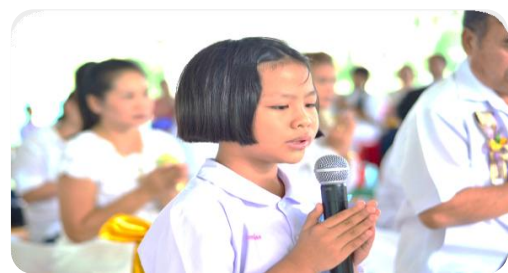
ประธานกฐินสัมฤทธิ์เด็กดี V-Star นำกล่าวคำถวายผ้ากฐิน