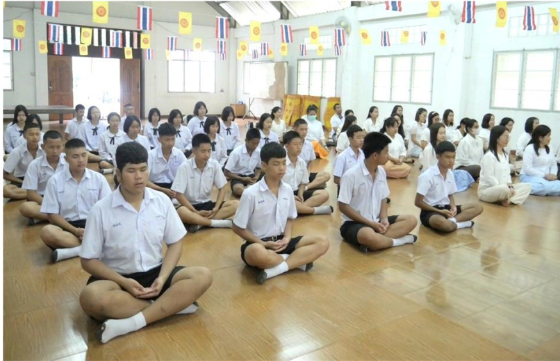
ภาพสาธุชน/นักเรียน นั่งร่วมกิจกรรมอย่างเป็นระเบียบสวยงาม